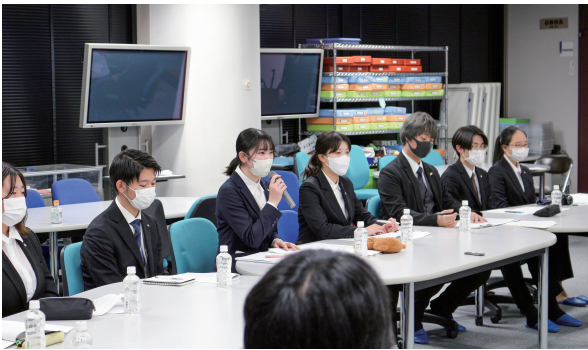
学長との意見交換会

ことができ、企画・運営を行う事への達成感を感じられました。また、対面開催であった学長・教職員の方との意見交換会では、学生からの意見・要望を基に先生方と有意義な意見交換会の実施ができました。様々の行事を、一からの企画運営また感染症対策を踏まえた行事開催など状況の移り変わりが激しく臨機応変に対応する力や様々な方とのコミュニケーション能力が求められました。貴重な時間を過ごし、大変なことが多い中でも達成感や充実感を得ることができました。それらは、教職員の方々と後援会の方々からのご協力があったからこそだと思います。学生代表として感謝申し上げます。