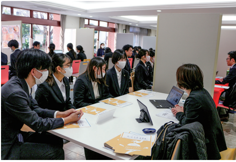
<学内業界説明会の様子> 本学多目的ホールで行いました

今年二月に、『学内業界説明会』を対面形式で実施しました。二月十三日・十四日に管理栄養士職採用企業から計二〇社、十五日・十六日には食品関係企業から計十八社の延べ三十八社に参加して戴くことができました。