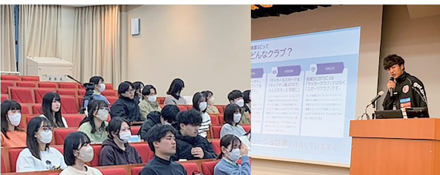
合同ゼミ（スポーツ栄養学）

携など地域に根差した活動に力を入れていきます。これらの取り組みを通し、学生は与えられたことを学ぶだけでなく、自分たちで考え立案し、行動できる学生に成長しております。 また今年度から海外研修が再開され、また四年ぶりに宿泊研修の再開も予定しているの新しい人間関係が作れると考えております。