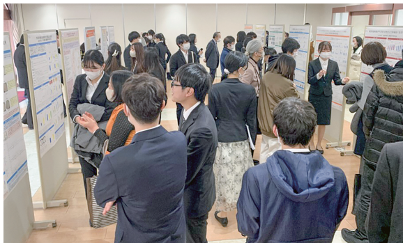
卒業研究・卒業制作ポスター発表会場風景