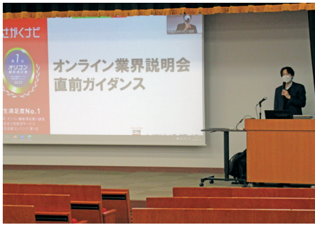
学内オンライン業界説明会事前ガイダンスの様子 対面・オンライン（ZoomでのLIVE配信）

今年一月には、三年次生対象に、オンラインマナーなど本選考にも活かせる内容を解説した『学内業界説明会の事前ガイダンス』を行い、一月に、『学内業界説明会（オンライン）』