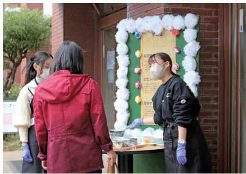
大学祭 学友会レストラン

り、試行錯誤を繰り返しながら準備等を進めました。出展企画等を検討する際には、先生方からのアドバイスを基に連日学生間等と話し合いを行って調整することの難しさを感じました。学生と先生方のご協力により、二日間の大学祭を無事に成功することができとても充実した機会となりました。