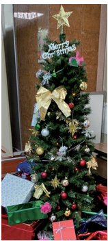
クリスマスツリー

十二月には、学生に少しでもクリスマス等の雰囲気を楽しんでもらいたいと思いクリスマスツリーを一号館(本館)の出入口に設置し、季節感のあるイベントとして行いました。