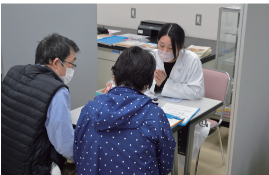
大学祭 栄養相談コーナー

二年次生は今までできなかったサークル活動、大学行事など積極的に参加し新しい大学活動の中心的役割を果たしてもらいたいと思えます。三年次生は臨地実習、就職活動が多忙な一年となります。学習の基礎を固め、社会との関わり、社会での役割を学修してもらいたいと思えます。四年次生は管理栄養士国家試験に向けての勉強が始まり、四年間の総まとめとなります。コロナ感染で人間関係が希薄になりがちでしたが、管理栄養士は人と人との関わりが重要視される仕事です。大学では仲間づくり、新しいことへのチャレンジを大切に行きたいと思えます。