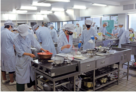
製菓・製パン実習

四年次生の就職活動については、学科全体としては昨年と比べて若干出遅れてはおりますが、コロナ禍の社会的状況を鑑みると健闘していると言えます。昨年度の卒業式は学位授与式として、スーツの着用で簡素に行いましたが、今年度は感染防止に努めながら、なんとか晴れの日にふさわしい式典が行えるように、切に願っております。皆様にも感染防止に多大なるご協力いただき、ここに改めて御礼申し上げますとともに、引き続き、日常生活における感染防止対策の徹底へのご協力お願い致します。