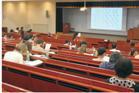
コロナ対応の授業風景

ような場合は実験実習もリモート配信せざるを得なくなることを想定して、教員も準備だけを行う体勢であります。前期の反省点を活かして、自宅でPC/インターネット環境が揃わない学生への配慮や、授業方法の検討等行いながら、遠隔授業においても教育効果が損なわれないように更に工夫していく所存です。