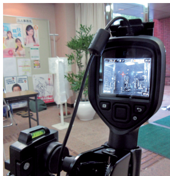
サーモカメラでの検温

本学を応援し、貴重なご意見をくださる後援会の皆様には、これからもご支援賜りますようよろしくお願いいたします。