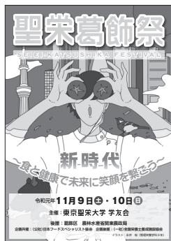
イラスト: 管理栄養学科3年 永井 栄

部・同好会等の団体と連携を図り準備を進めております。学友会の特別企画として、毎年恒例の「学友会レストラン」「もちつきイベント」「サンデークッキング」「お笑いライブ」「バザー」「クイズラリー」等の企画を行う予定です。また、今年度の目玉企画のひとつに学友会顧問(健康栄