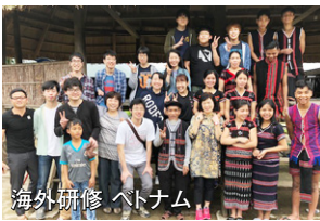
海外研修 ベトナム

な分野を学んでいます。また、就職のためのキャリアリサーチの授業も開講し、就職試験の対策から、就職先の選び方等学んでいます。三年次生は研究室配属になり、大学での研究活動がスタートしました。各ゼミで歓迎会が開かれ、ゼミの先生や四年生との交流を通して、これからの研究や就職活動について考える時間が持てたようです。また、インターンシップの授業が開講し、夏期休暇中に食品の一般企業や官公庁での実社会を経験する機会を得て、将来の進路を決定するうえでもよい機会になりました。四年次生は就職活動も順調に進み、多くの学生が希望企業から内定を頂いたようです、うれしい限りです。また、四年間の学びの集大成となる卒業研究、卒業制作に取り組み、学生自らが研究を計画し遂行していくことは大きな力になると期待しています。 食品学科では教員が一人ひとりに、より良い学びを提供できるように、学生一人ひとりを全力で支援してまいります。保護者の皆様には今後ともご支援・ご協力よろしくお願いたします。