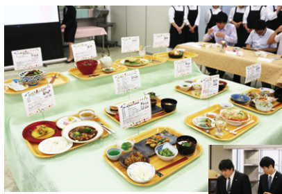
かつしか元気食堂 メニューコンテスト

初めての長い夏休みに悪い生活習慣が身につく、修正することができずに苦戦している者が多々見られます。一・三年次生は、専門知識を習得する大切な時期ですが、深夜に及ぶアルバイトやスマートフォンゲームに夢中になるなど、復習・予習に時間を費やす事を日課に加えない学生が目立ちます。このような三年間を送った学生が、四年次生になり、就職活動と管理栄養士国家試験受験のための総合科目の単位取得が重なり、精神的にも肉体的にも追いつめられる日々を送ることになってしまいます。卒業までに達成する目標を決め、目標達成のために、自らが、何をどのようにするべきかを考え、計画→実施→評価→改善を繰り返し、繰り返して頂きたいと願っています。