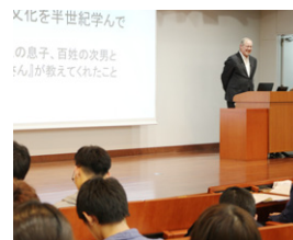
文化を半世紀学んでの息子、百姓の次男と寅さんが暮らしてきたこと

四月二十六日(木)、「新入生歓迎会」が開催されました。今回の講演会は、本学がキャンパスを構える葛飾区の歴史や文化について知識を深めていただく為に、早稲田大学元教授ワットポール氏より「日本文化を半世紀学んで…浪人の息子、百姓の次男と『寅さん』」