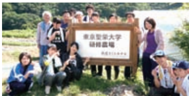
フィールド研修（長野県伊那市）