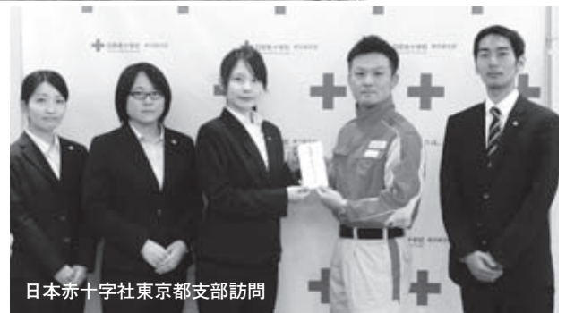
日本赤十字社東京都支部訪問