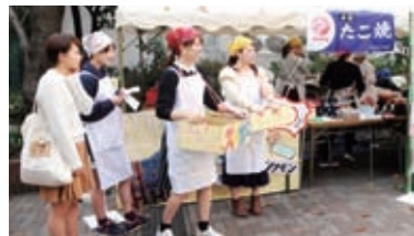
昨年度の聖栄葛飾祭