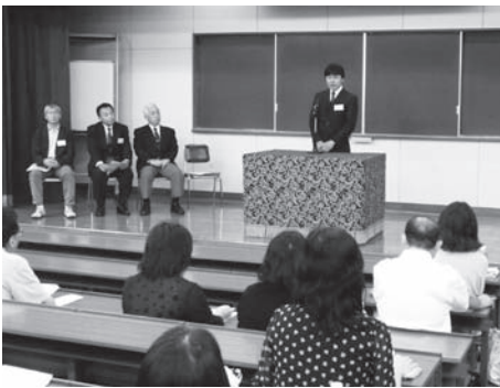
昨年度の保護者会

保護者会終了後は、後援会主催による教員との情報交換会を行い、学長を始め学科長や学年担任、教科担当教員との懇親会を予定している。(事前予約制希望者のみ)保護者の皆様のご参加をお待ちする次第である。