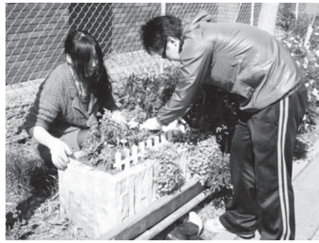
区より提供された苗の植え込み