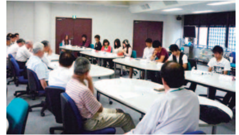
学生との意見交換会 (H23.6.9)