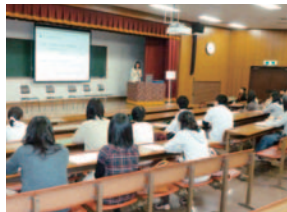
国家試験体験講話

卒業や年度末をひかえたこの時期、学内は、直前講習会や国試合格を目指す四年次生の熱気と学年仕上げの定期試験に臨む学生たちの緊張感で満ちている。特に四年次生は、図書館や自習室を利用し、自分達の「決意表明入り、試験まであと〇〇日のポスター」を励みに遅くまで頑張っている。三年次生は十月に臨地実習の一回目の報告会を行い、これを糧に次の臨地実習に備えている。この臨地実習は、これから本格化する就職活動や国試に取り組む心構えの醸成に大変重要な情報をもたらすものであり、二年次生の報告会への出席も義務付けている。また、三年次生は十二月に栄養士