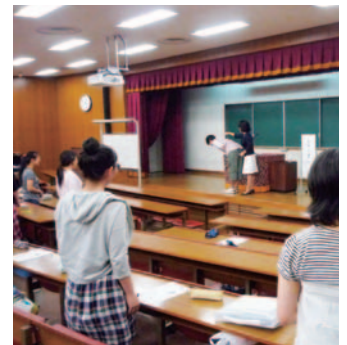
1年次生マナー講座 (H23.6.24)