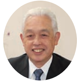
健康栄養学部学部長