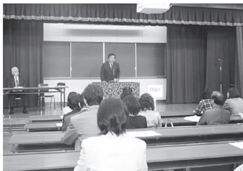
昨年度の保護者会

お忙しい中、保護者の皆様にご出席いただきご子息、ご息女の学内での様子や、本学の教育