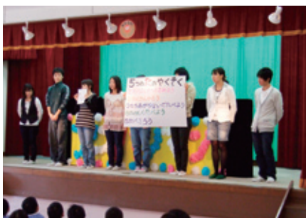
ママと子どもの楽しい食育（わたなべ幼稚園） (H21.11.20)