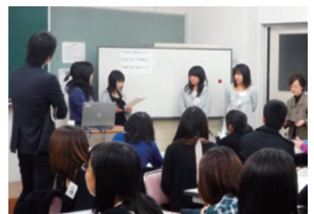
就職活動のためのディスカッション講座 (H21.12.17)