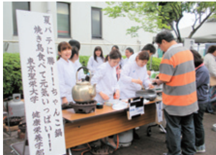
地域共創活動（わんぱく相撲） (H21.5.17)