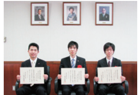
東京聖栄大学奨学金授与式 (H21.5.26)