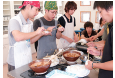
フィールド研修 (H21.8.3 ~ 8.5)