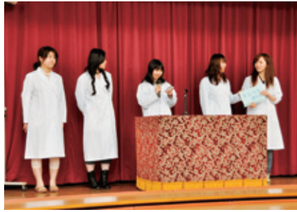
部・同好会説明会 (H21.4.7)