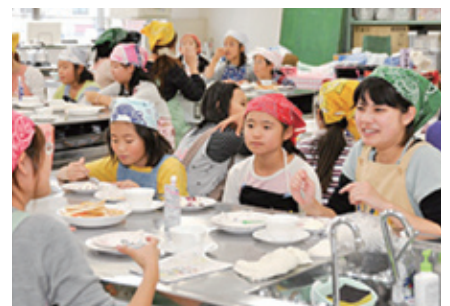
聖栄葛飾祭 (H21.11.7 ~ 11.8)