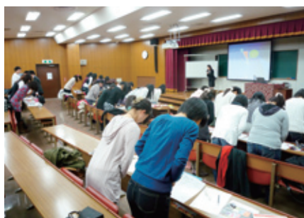
就職活動のためのマナー講座 (H21.12.2)