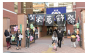
「聖栄葛飾祭」入場門

葛飾区連携コーナーでは、日本フードスペシャリスト協会との共催により、本学の食育連携事業「食育サポーター事業in葛飾区」の広報事業を行い、本学と葛飾区保健所・地元商店会との協働・連携による食育事業の成果を発表した。