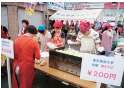
地域共創活動（新小岩ふるさとづくりフェスティバル） (H21.8.22 ~ 8.23)