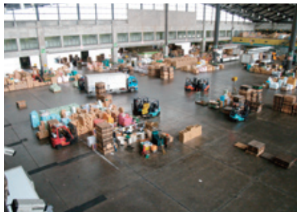
都内市場見学 (H21.7.31 ~ 8.1)