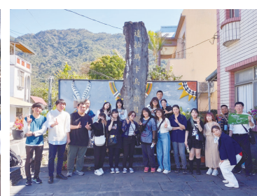
台湾の食文化研修会