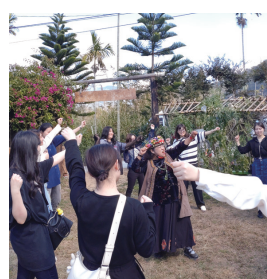
ルカイ族の方々と交流

なお、令和6年4月3日（水）に発生した台湾東部沖地震の被災者の方々にお見舞い申し上げます。