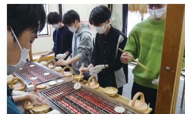
草加せんべいの製造体験