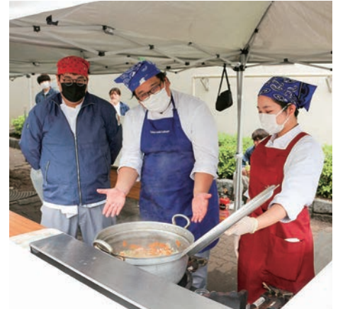
模擬店（調理技術研修生他）