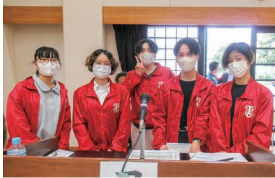
総合司会（学生会役員）

令和5年5月14日（日）に、第46回わんぱく相撲葛飾区大会が開催され、東京青年会議所葛飾区委員会を中心とした実行委員会の協力依頼に基づき、本学学生による総合司会、および模擬店の出店（カレーライス、ちゃんこ汁）協力を行いました。参加協力した学生達にとって、地域の方々と交流する機会として有意義な活動となりました。