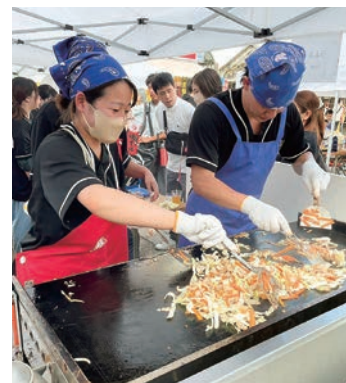
小松菜入り特製焼きそば販売