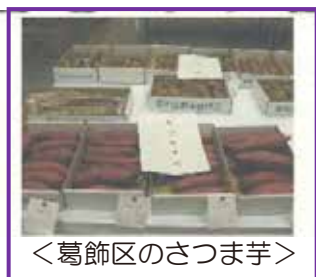
<葛飾区のさつま芋>

葛飾元気野菜直売所をはじめ、各イベントの野菜即売会などでも販売されます。ぜひ、お試しください。