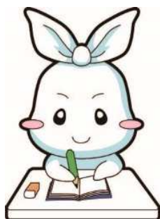
葛飾区ごみ減量・3R推進キャラクター リー（Ree）ちゃん