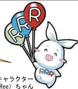
葛飾区ごみ減量・3R推進キャラクターリー（Ree）ちゃん

いつもの食べ方以外にも、一度にたくさん食べられる調理法などで工夫をすることで、食品ロスを減らすことにも繋がるね。