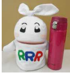
お出かけ時はマイボトル