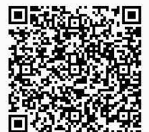
▲電子申請は こちらから