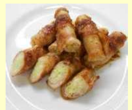
▲令和2年度最優秀作品 「ブロッコリーの 芯の豚肉まき」

FAX 03-5698-1534 メールアドレス 060800@city.katsushika.lg.jp