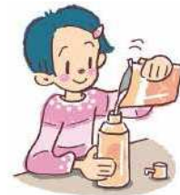
つめかえ用を選ぶ