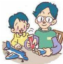
修理などして大切につかう