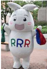
いつもポッケに マイバッグ