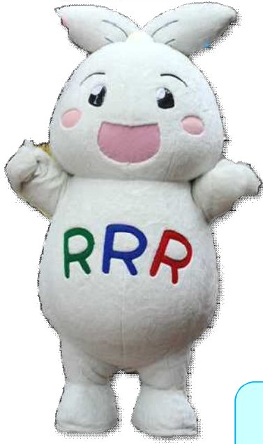
葛飾区ごみ減量・ 3R推進キャラクター （Ree）ちゃん

エコライフプラザ通信では、食材の無駄をなくし、 ごみを減らすための提案を、東京聖栄大学・ 東京聖栄大学附属調理師専門学校に ご協力いただき、連載します。