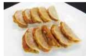
「ヘルシー大根餃子」