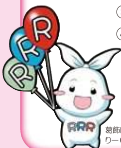
葛飾区ごみ減量・3R推進キャラクター リー(Ree)ちゃん