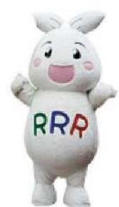
りーちゃんも遊びに行きました♪