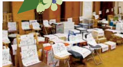
リユース家具の無料提供は、今年も大盛況でした♪