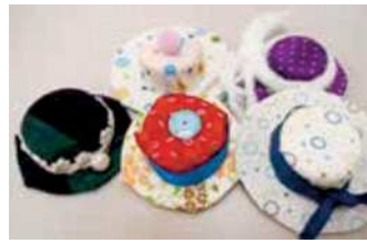
エコマグネット作り♪