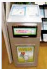
小型家電回収ボックス 回収にご協力いただき、ありがとうございました。