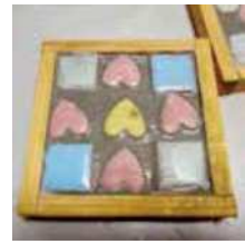
端材で作る モザイクタイル♪