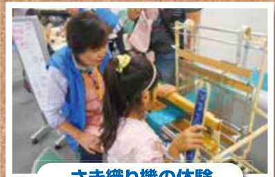
さき織り機の体験