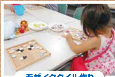
モザイクタイル作り