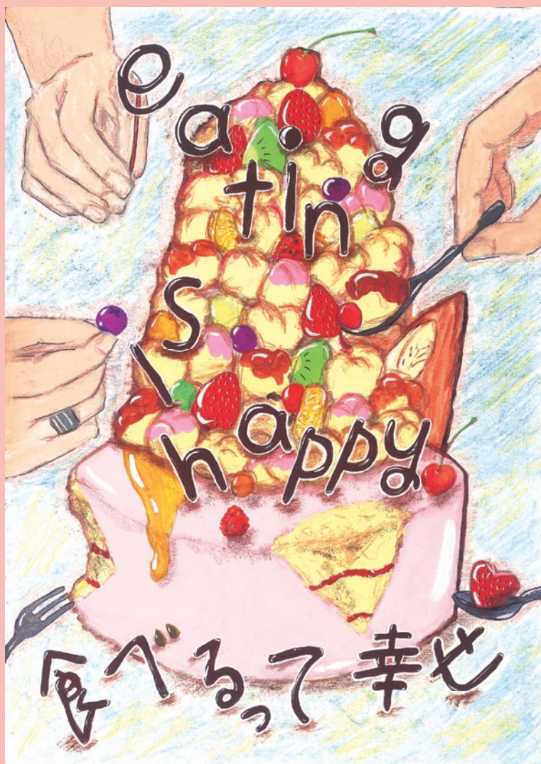
イラスト：鎌田亜沙美（食品学科2年）